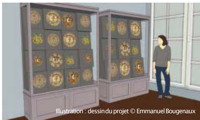
Illustration : dessin du projet © Emmanuel Bougenaux

orchestrée par le socleur Emmanuel Bougenaux. De cette manière, la vocation décorative et narrative de cette vaisselle italienne composée de faïence lustrée aux couleurs éclatantes, produite pendant la période de la Renaissance, aux XV e et XVI e siècles, et destinée à l'ornementation et à l'apparat, va lui être rendue. L'occasion de donner un coup de projecteur sur ce fleuron des collections du musée.