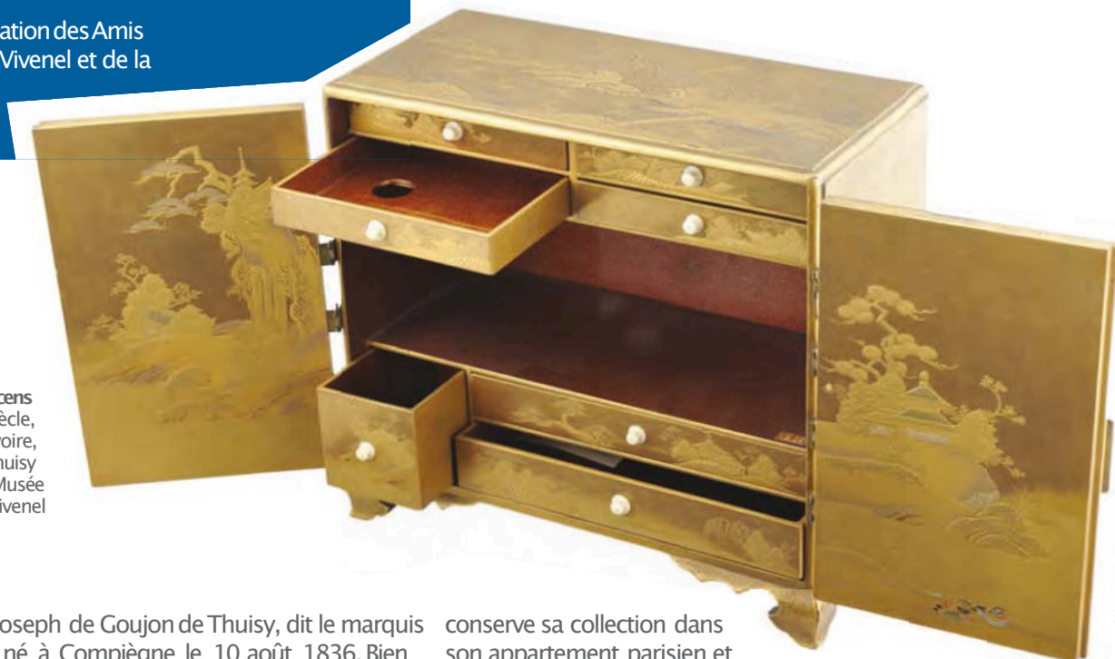
Cabinet pour le jeu de l'encens Japon, XVIII e siècle, Laque, or, métal et ivoire, Legs Thuisy